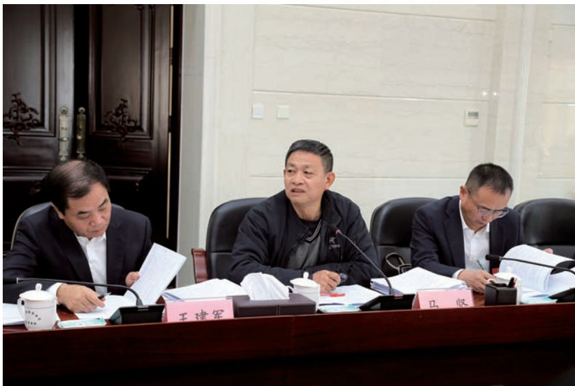
▲ 常委会组成人员审议备案审查工作报告。

坚持人大常委会主导统筹。自治区人大常委会建立同步审议备案审查工作报告机制，明确由自治区人大常委会法工委牵头组织实施，并提出具体责任主体、时间节点和工作要求，统筹协调“一府两院”做好报告起草、报送等工作，确保同步审议工作有序推进。