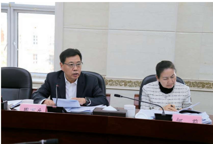
▲ 常委会组成人员就备案审查工作提出意见建议。

2025年11月19日，自治区十三届人大常委会第二十一次会议审议了自治区人大常委会法工委和自治区人民政府、自治区高级人民法院、自治区人民检察院（以下简称“一府两院”）的备案审查工作报告。这是自治区人大常委会首次就备案审查工作同步审议监督主体与监督对象的工作报告，对于推动形成横向协同、纵向贯通的备案审查工作格局具有重要意义，进一步强化了