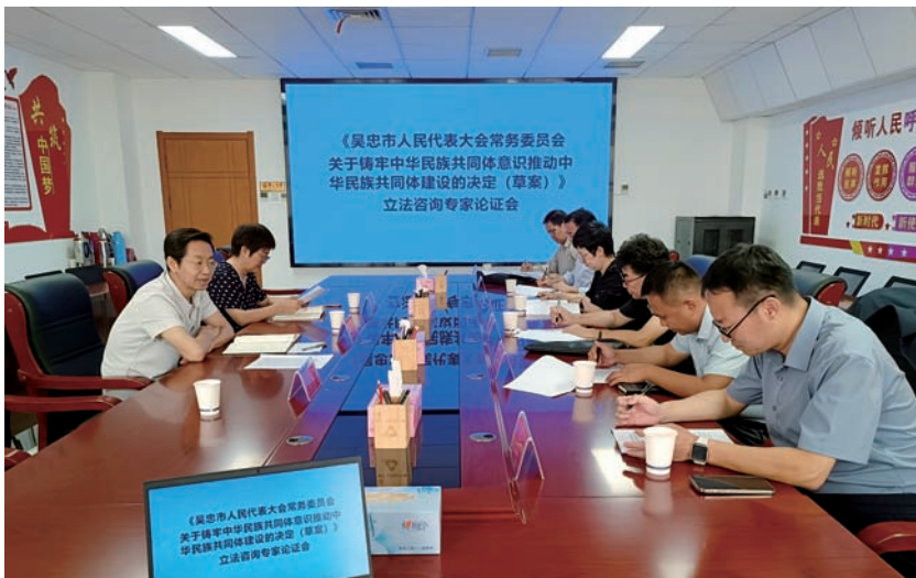
▲ 吴忠市人大常委会召开立法咨询专家论证会。