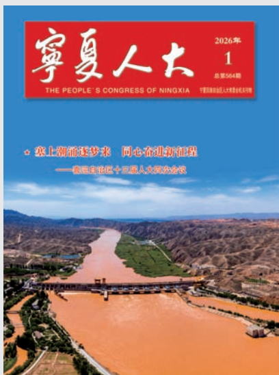
封面：青铜峡黄河大峡谷