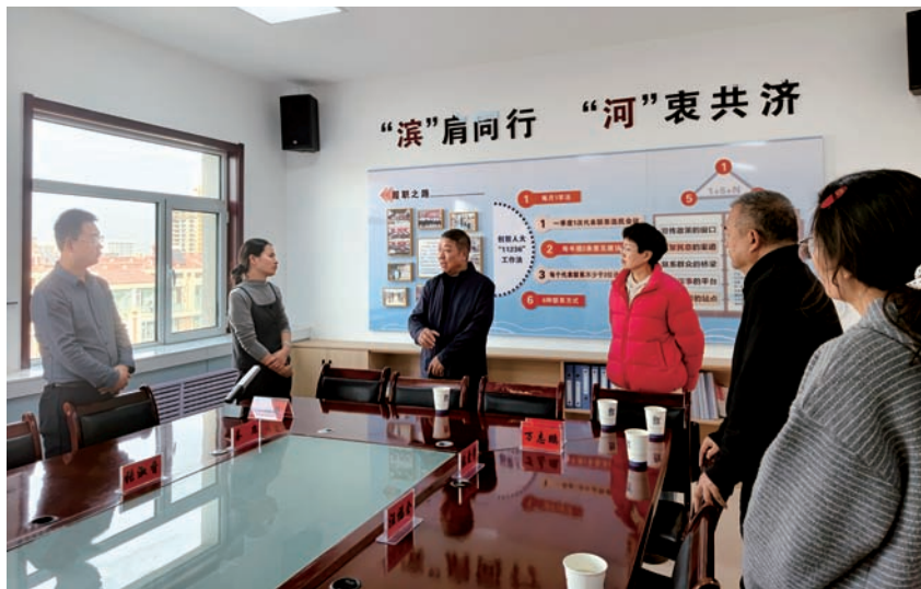
▲ 中卫市人大常委会在沙坡头区滨河镇开展立法调研工作。

2025年7月，“云天中卫·荆楚有约”中卫市农特产品招商推介会在湖北孝感举办，10余家龙头企业携枸杞、硒砂瓜、牛羊肉等20余种优质农特产品集中亮相，现场达成多项合作协议。