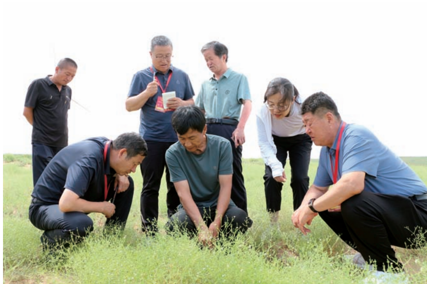
▲ 盐池县人大常委会组织人大代表调研全县黄花产业发展情况。

2025年，盐池县人大常委会深入贯彻落实习近平总书记关于坚持和完善人民代表大会制度的重要思想，按照自治区人大“稳增长促发展”主题实践活动部署要求，通过宣传政策、建言献策、示范带头等形式，以奋进姿态依法履职尽责、主动担当作为，充分发挥代表作用，确保主题实践活动走深走实、见行见效。